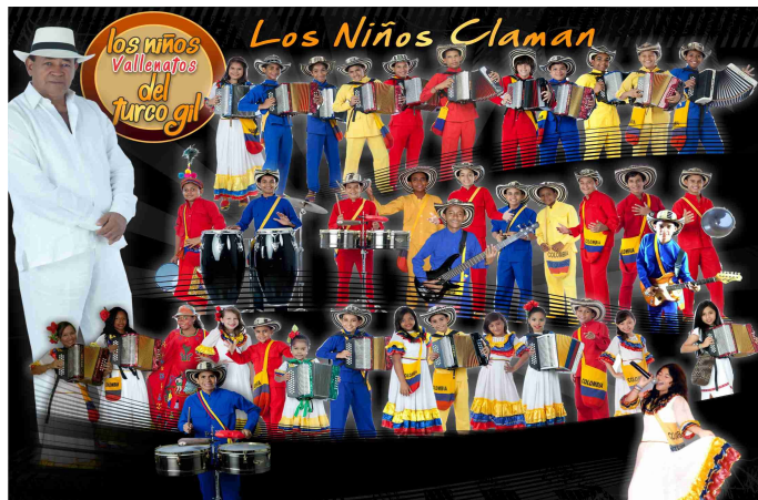
2012 – Los niños claman