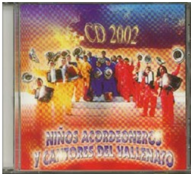
2002 - Anhele un futuro