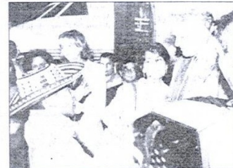
Con mucha atención el ex presidente Bill Clinton, escuchó el saludo vallenato.

• Así se lo hizo saber al maestro Andrés 'El Turco' Gil y a los Niños Acordeoneros y Cantores del Vallenato, a quienes inicialmente los llevará a su tierra natal. El ex presidente de los Estados Unidos recibió la estatuilla 'La Pilonera Mayor'. • La Academia de Música Vallenata está dando buenos resultados.