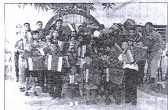
Ayer escuela, hoy academia de música sigue cosechando buenos resultados, ahora a través de Los Niños Acordeoneros y Cantores del Vallenato.